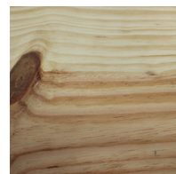
Choix Nouveux 310034