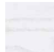
Frêne blanc 15250